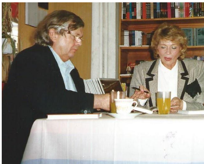
Autogramiáda v Galerii časopisu Květy